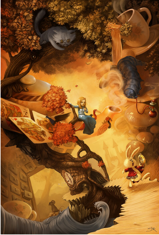
digital painting Alice in Wonderland (2010) by David Revoy